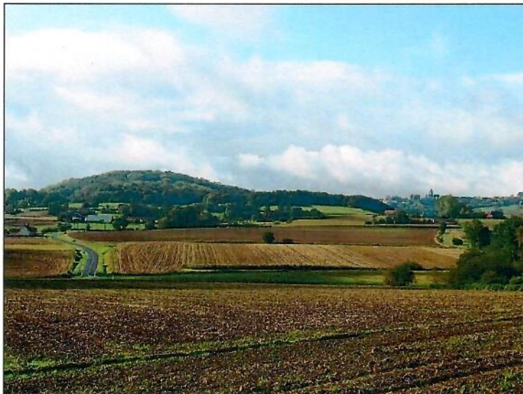
Mooie landschappen rond de Kasselberg

Zuidpene ligt in een rustige en groene omgeving, aan de voet van de Kasselberg, op 15 km van Poperinge.